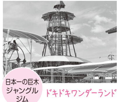
日本一の巨木ジャングルジム ドキドキワンダーランド