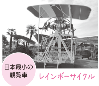
日本最小の観覧車 レインボーサイクル