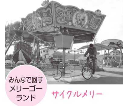
みんなで回すメリーゴーランド サイクルメリー