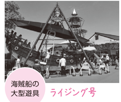
海賊船の大型遊具 ライジング号