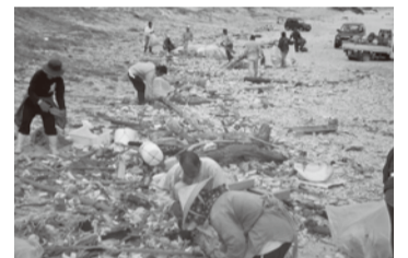
▲漂着したごみを清掃する島民