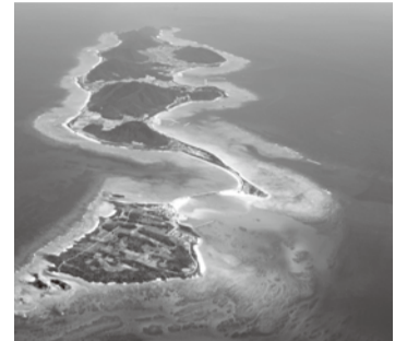
▲もずくが育つ美しい海の伊平屋島

美しい自然を守りながらくらしている伊平屋島の海岸に、近年大量のごみが漂着し続けています。島をあげて清掃活動を行っても島内にごみ処理施設がなく、船で運びだしており、島にとって大きな負担となっています。