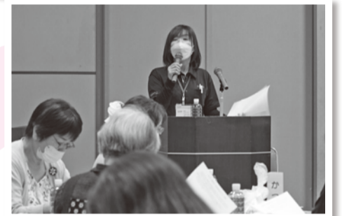
昨年の支所別総代会の様子