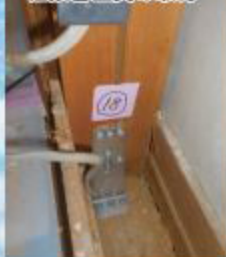
柱接合金具の取付